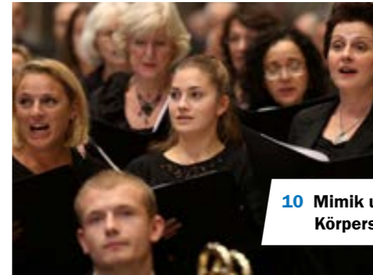
10 Mimik und Körpersprache