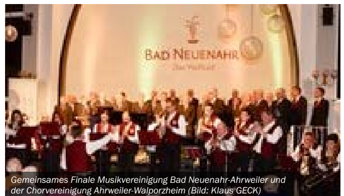
Gemeinsames Finale Musikvereinigung Bad Neuenahr-Ahrweiler und der Chorvereinigung Ahrweiler-Walporzheim