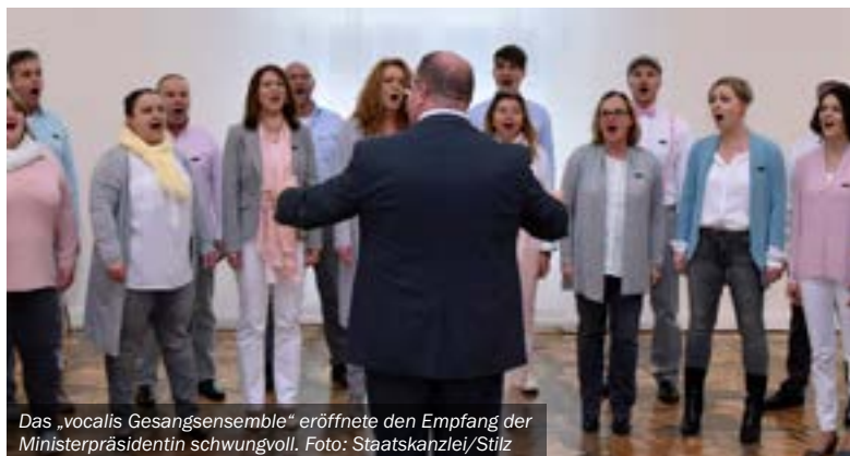
Das „vocalis Gesangsensemble“ eröffnete den Empfang der Ministerpräsidentin schwungvoll.

In ihrer Ansprache gratulierte sie den Musikerinnen und Musikern zu ihren außerordentlichen Leistungen bei den unterschiedlichen Musikwettbewerben. Als Kulturland zeichne sich Rheinland-Pfalz durch eine „Kultur für alle“ und eine „Kultur überall“ aus.