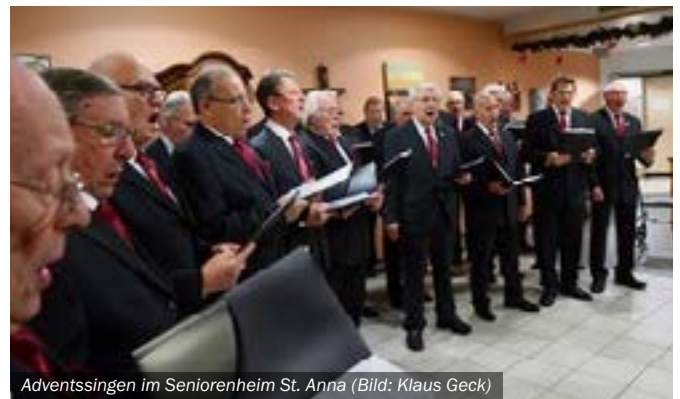
Adventssingen im Seniorenheim St. Anna